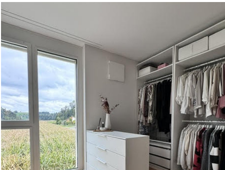
Ankleide mit Ausblick ins Grüne