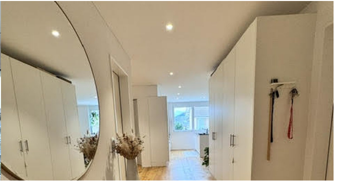
Eingangsbereich mit integrierten Einbauschränken