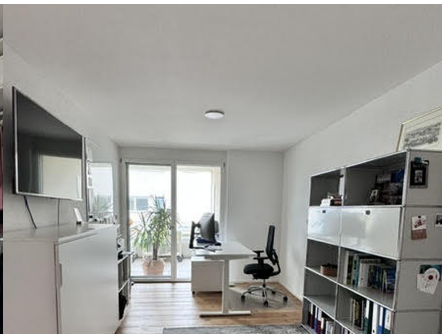
Büro/Zimmer mit Balkonzugang