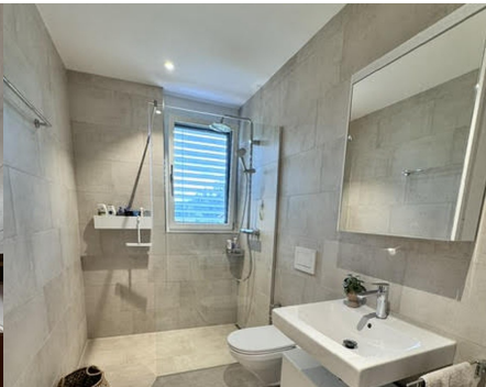
Duschbad – modern & stilvoll