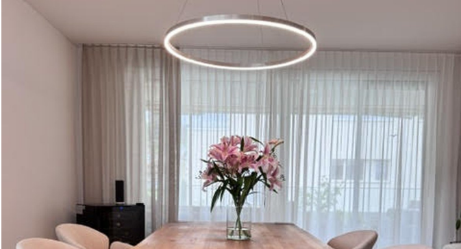
Ess- & Wohnbereich mit Eichenparkett