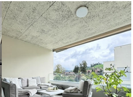
Balkon – Lounge mit Weitsicht