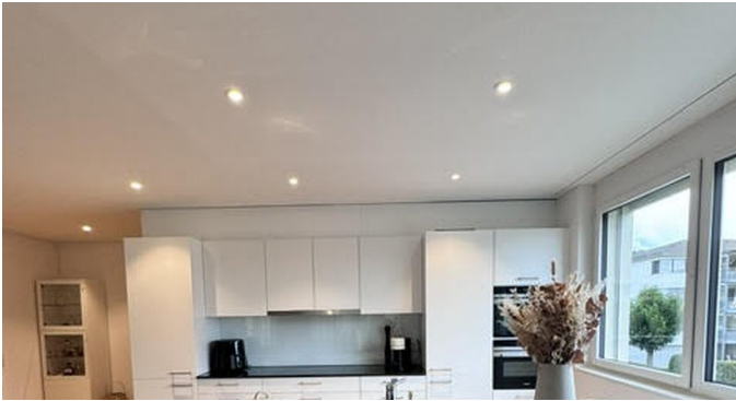
Küche mit Kochinsel, Backofen & Combisteamer