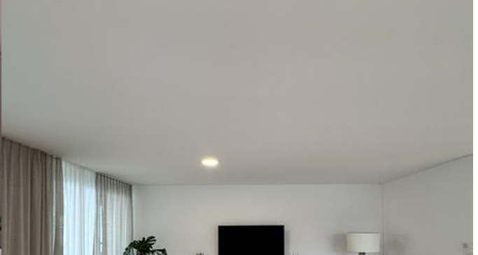
Wohnbereich mit grosszügigen Fenstern