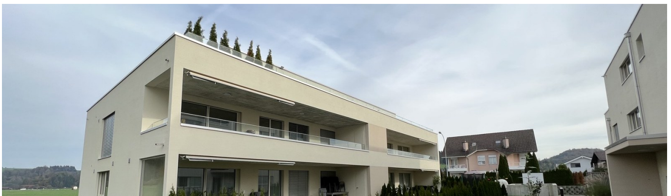
Gesamtansicht Überbauung Schmittenhof 22 · 6142 Gettnau LU

Zwei Garagenplätze · Kellerabteil · Lift · Besucherparkplätze