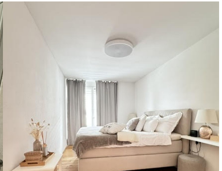
Schlafzimmer hell & ruhig