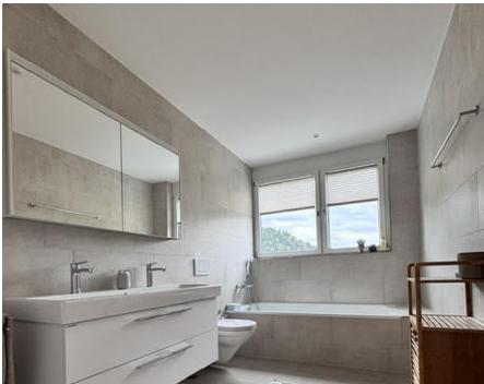
Vollbad mit Badewanne & Doppellavabo