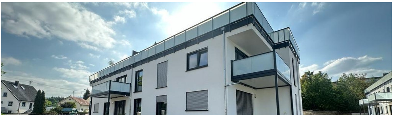
Gesamtansicht · Hesselbergstraße 26+28 · 72336 Balingen-Frommern

Lift in beiden Häusern · barrierearmer Zugang