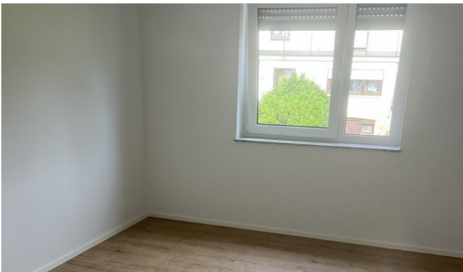
Zimmer – helle Räume mit hochwertigen Böden