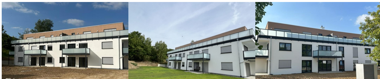
Aussenansichten · Hesselbergstraße 26+28 · Balingen-Frommern