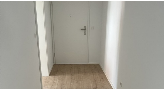
Eingangsbereich / Flur mit Holzboden