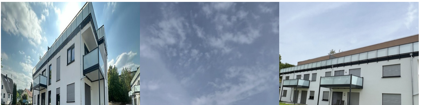
Moderne Flachdach-Architektur mit grossen Balkon- und Terrassenflächen