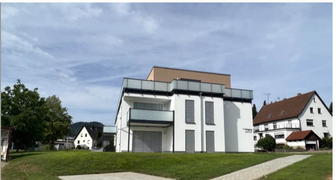
Aussenansicht mit begrünten Aussenanlagen